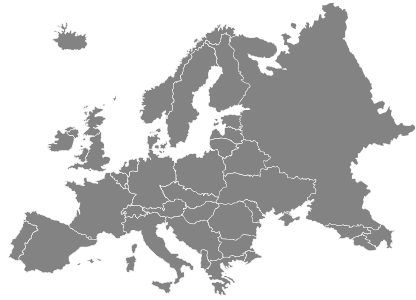
УКРАЇНА ТА ЄВРОПА

За умовами програми «Україна» послуги надаються Клієнту на всій території України, за винятком тимчасово окупованих територій та територій, на яких ведуться бойові дії.