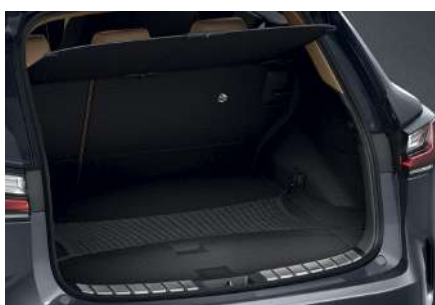
Сітка для багажника горизонтальна