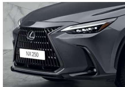
Декоративна накладка переднього бамперу