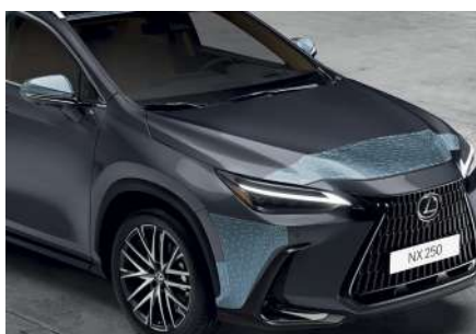
Комплект захисних плівок кузова