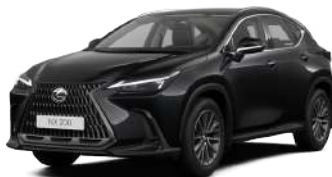
223, Чорний графіт