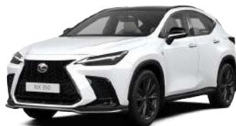
083, Білий F Sport**