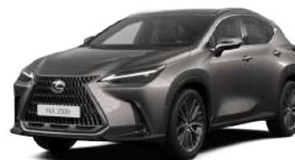
117, Титановий сірий