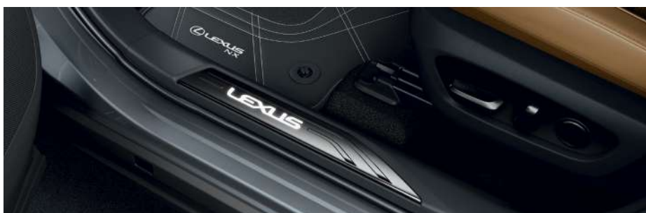
Накладки порогів з підсвіткою