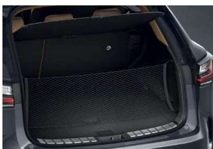
Сітка для багажника вертикальна