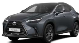
111, Хромовий сірий