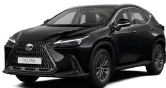
212, Чорний лак*