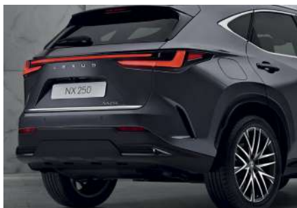
Декоративна накладка дверей багажника