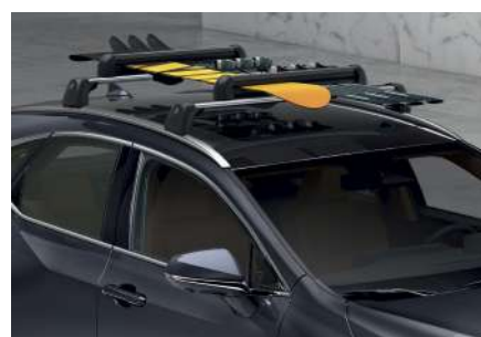
Поперечини даху та кріплення для лиж та сноуборду