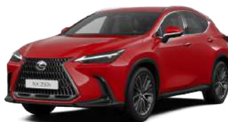
3Т2, Мареновий червоний*