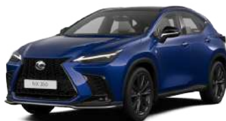
8X1, Синій сапфір**