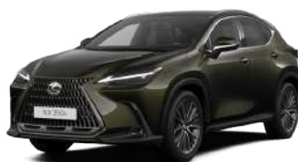
6X4, Террейн хакі