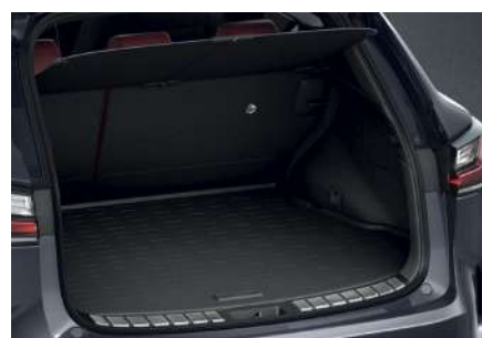
Гумовий піддон багажника