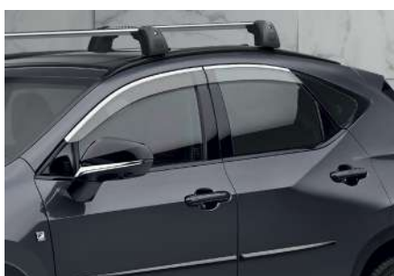
Дефлектори вікон з хромованим окантуванням